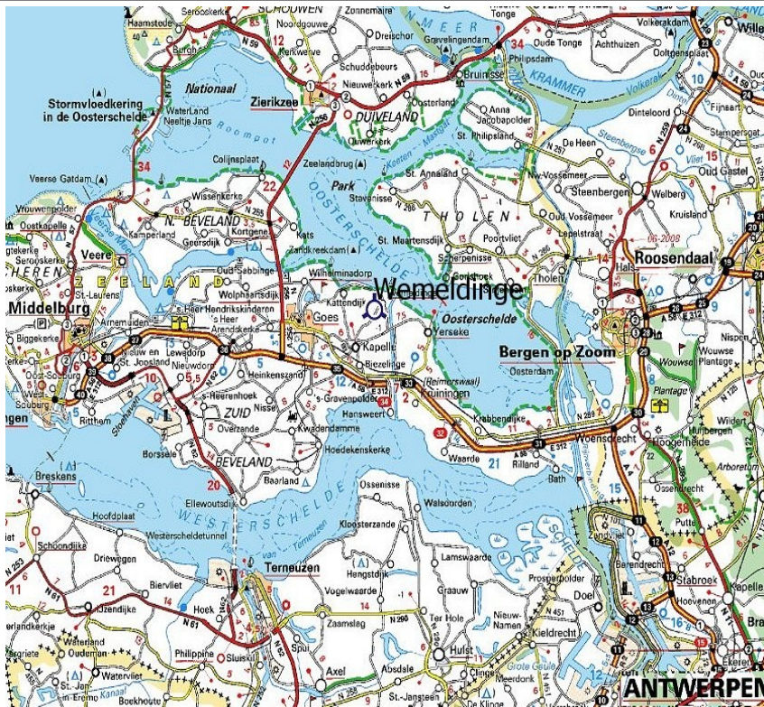
Karte 1 / Wemeldinge liegt im Herzen von Zeeland, 60 km von Antwerpen und 35 km von Bergen op Zoom in Noord-Brabant, sowie Vlissingen entfernt.

Tel. 0031 (0)113 621294 Mob. 0031 (0)6-25092508 info@derderonde.nl www.derderonde.nl