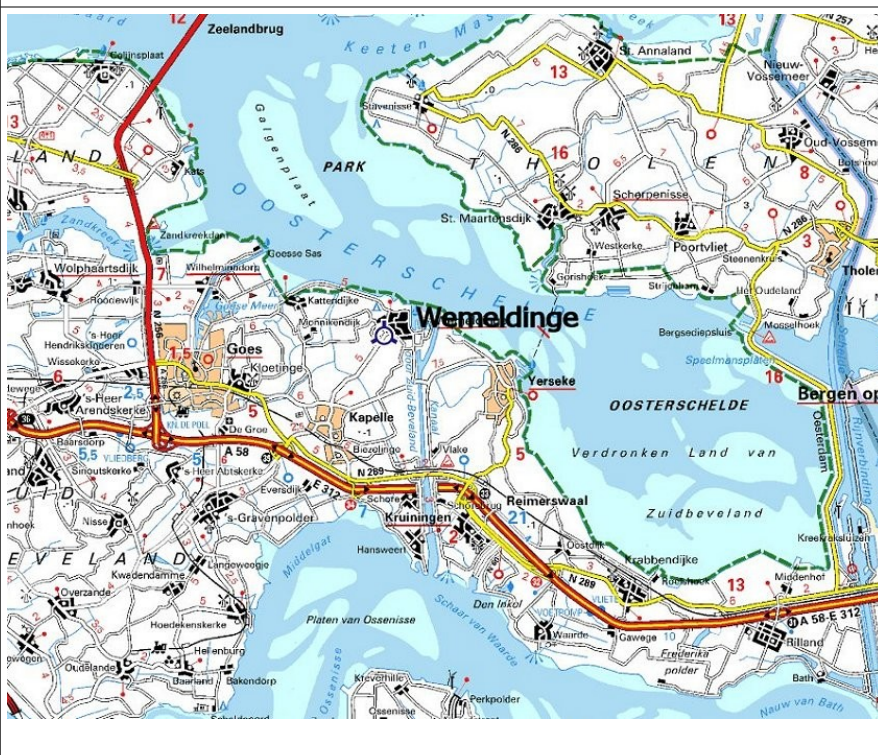
Karte 2 / Wemeldinge erreichen Sie sehr einfach über die Autobahn A 58 von Roosendaal / Bergen op Zoom nach Middelburg / Vlissingen oder entlang der Oosterschelde von Zierikzee Richtung Wemeldinge